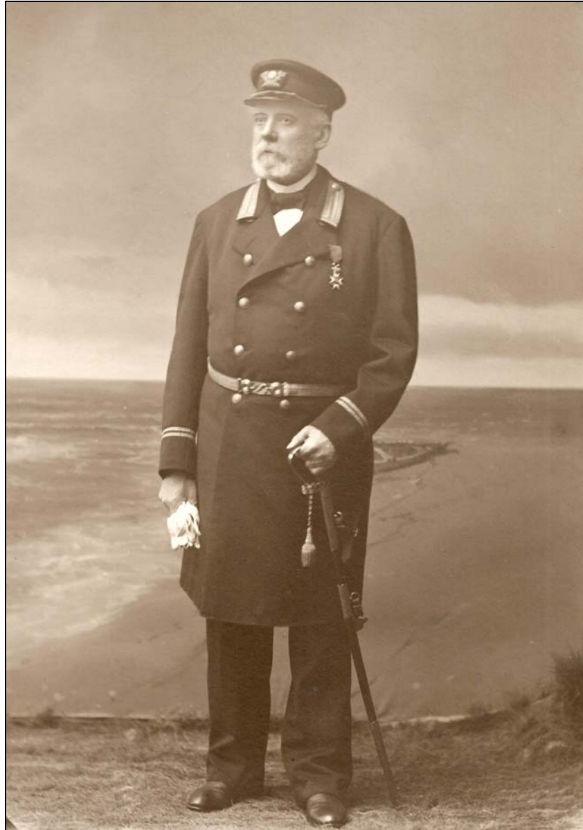
Foto föreställande Fängelsedirektören och Riddaren av Wasaorden [20] Gustaf Garström, troligen taget i slutet av 1800-talet i Härnösand.

Det är antecknat att familjen flyttat in från Umeå stadsförsamling den 1 aug 1882.